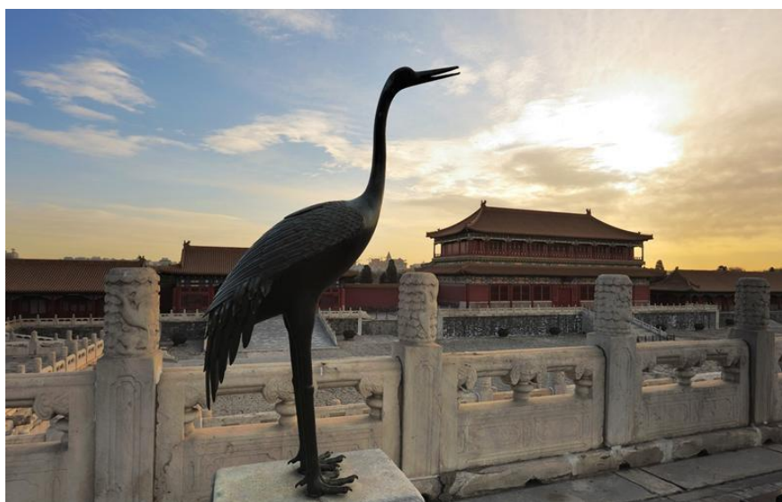
Förbjudna staden i skymningen

10 Förbjudna staden är den innersta delen av Pekings centrum. Härifrån residerade Ming- och Qingkejsarna och ingen vanlig människa fick sätta sin fot innanför murarna. Palatskomplexet består av 9 999 (och ett halvt) rum, eftersom endast himlen kunde ha 10 000. Kejsaren betjänades av 9 000 hovdamer och 10 000 eunucker. I filmen "Den siste kejsaren" är många scener från denna epok filmade i Den förbjudna staden.